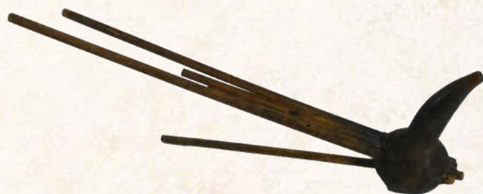
Orgue à bouche.