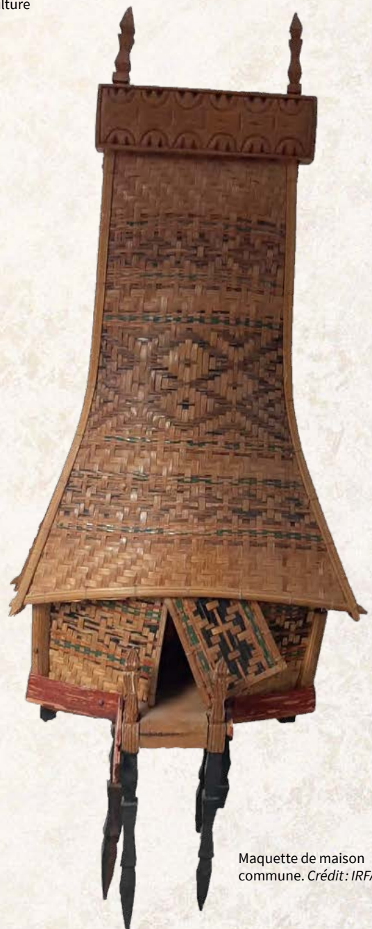
Maquette de maison commune.