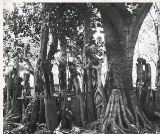
Statues funéraires, du bois brut au retour à la nature.