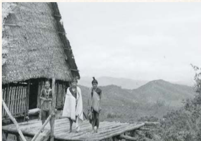
En tournée dans des villages, avec ses scouts sré.